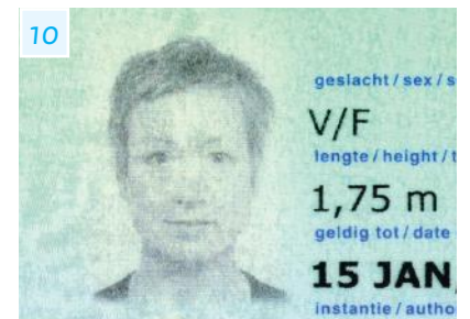
Tweede afbeelding van de foto

Dit is een uitgave van: Ministerie van Binnenlandse Zaken en Koninkrijksrelaties Postbus 20011 | 2500 EA Den Haag www.rijksoverheid.nl