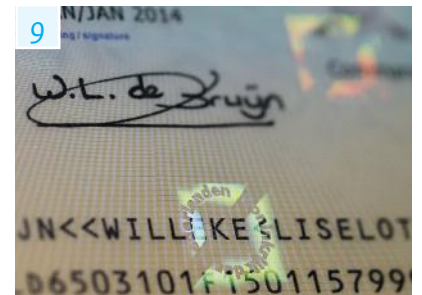
Folie met holografisch beeld